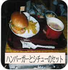
ハンバーガーとチキンのセット

四季の杜の食事は職員の手作りです。食品衛生責任者も置き、栄養管理も行い衛生管理や栄養バランスもしっかり考えています。手作りにこだわっている理由として、利用者様の状態