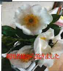
前橋市福祉協議会様より頂きました