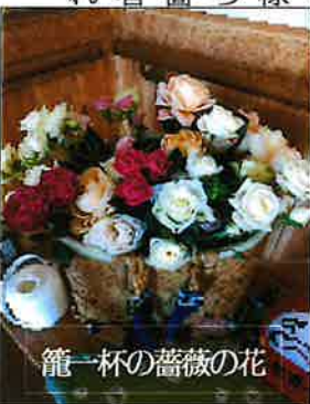
籠一杯の薔薇の花