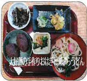
大豆の手作りおぼろうどん

や嗜好に応じられます。そして、食事をおいしくしつかり食べていただきたいからです。「孫が来ていた時はよくハンバーガーを食べたけど、また食べたいね」と