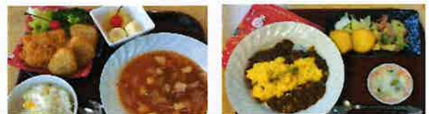
クリスマスメニューも好評でした！！

12月はクリスマスツリーやご利用者様に制作していただいた作品を飾りつけしました。特に19日～24日は「クリスマス週間」クリスマスソングを流して体操やレクリエーションを行いました。サンタさんからお菓子のプレゼントもありました。